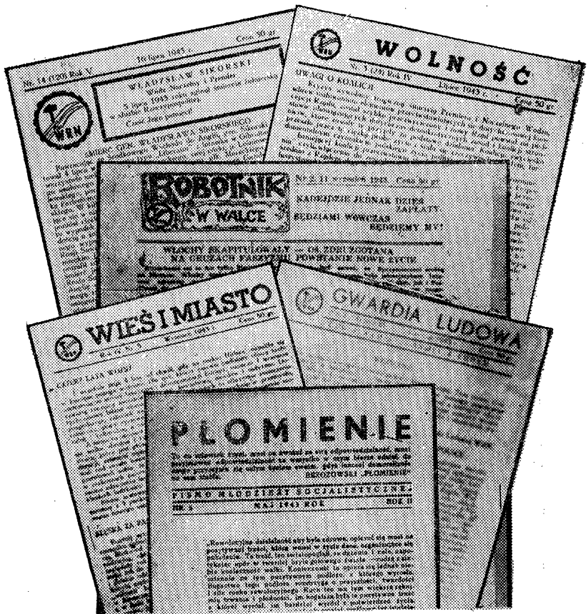
אונטערערדישע פוילישע סאציאליסטישע צייטונגען.

איז אַרויס דער לעצטער נומער פון אונזער אַרגאַן אין וואַרשעווער גע- טאָ — אַלץ אין דער יידישער שפּראַך. אזוי איז פאַרענדיקט געוואָרן דאָס רומרייכע קאַפיטל פון דער בונ- דישער פרעסע — אפּשר דאָס רומרייכסטע אין דער געשיכטע פון דער אומלעגאַלער פרעסע בכלל — אין געטאָ. מיר שטרייכן אונטער אין גע- טאָ, ווייל די געשיכטע פון דער אומלעגאַלער בונדישער פרעסע אין